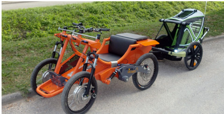
Santiago Accessible, un pèlerinage vers Santiago, où les valeurs civiques et la spiritualité se rejoignent sous la devise : « Liberté, Égalité et Fraternité ».

Santiago Accessible promet d'être une belle aventure civique sur le chemin de Saint-Jacques. Du 24 juillet au 4 août 2013, depuis la ville de Martel, au nord du Lot, en passant par le sanctuaire de Rocamadour, aujourd'hui inaccessible, 12 « pèlerins » handicapés, feront route sur leur Mobile Dream, pour rejoindre Gavarnie à la frontière espagnole. Des animations et manifestations les attendront à chaque étape.